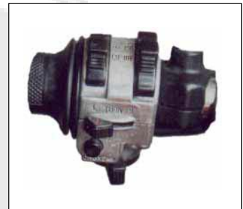
Blinkerschalter nachträglich poliert Verkaufsversion schwarz / matt

Mit diesem Schaltplan können Sie unseren Blinkerschalter universal, schwarze Metallausführung mit der Artikelnummer 300235100 (siehe Abbildung rechts) an fast jedes Motorrad verbauen.